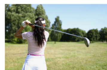
ゴルフ・野球・サッカー など屋外スポーツに