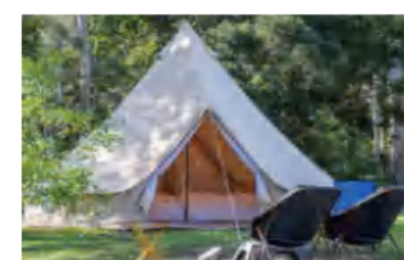
登山・ハイキング・キャンプ・ 釣りなどアウトドアレジャーに