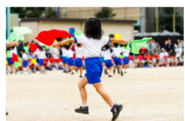
学校行事・部活動・お祭り など大規模野外イベントに