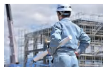
建設工事・通信設備点検・ 農作業など屋外の作業現場に