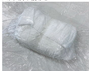
パック済み紙おむつ

投入口に使用済み紙おむつを入れるとオートスタート/ストップ機能により自動でパックします。消耗品のパックフィルムの交換もカンタン設計です。