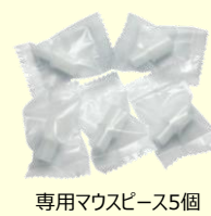
専用マウスピース5個