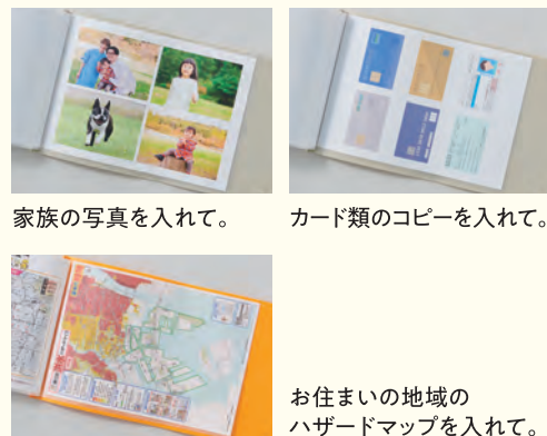
家族の写真を入れて。