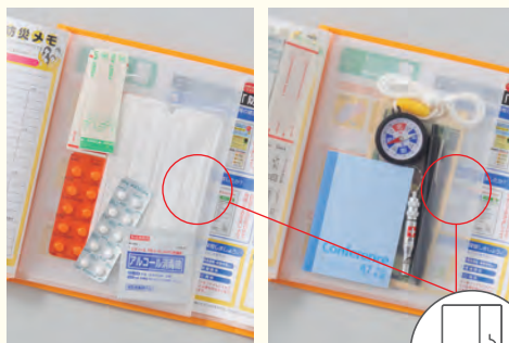
メディカル・感染症対策に。