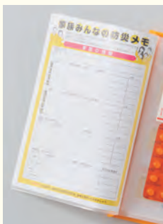
付属の【家族みんなの防災メモ】が入ります。