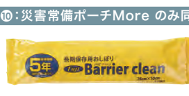
9 大判おしぼり (からだ拭き)