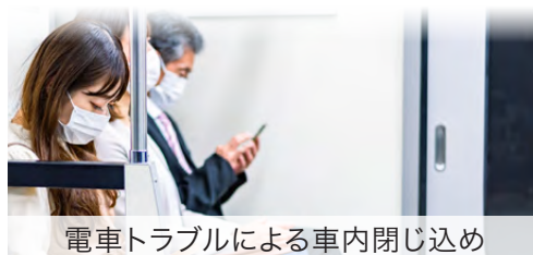
電車トラブルによる車内閉じ込め

いつでもどこで起きるかわからない災害やトラブル。 移動中でも、出張中でも、旅行中でも。 外出先での「もしも」に備え、常に持ち運べる防災セットです。