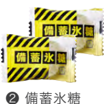
2 備蓄氷糖 (2個)