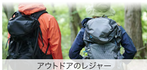
アウトドアのレジャー