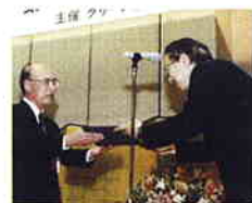
第6回グリーン購入大賞授賞式

これは、自社の置かれた立場やマーケットでの影響力を十分理解され、環境を始めとする様々な問題点に対して、企業の社会的責任として取り組んでいかれるという決意だと思います。当社も微力ながら、ミズノ様の様々な取り組みに対して、お役に立てるグリーンパートナーでありたいと思います。最後になりましたが、更なるCSR活動の推進を期待しております。