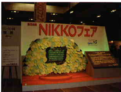
38回NIKKOフェアエコ宣言の木

エコ宣言をご希望される方は、パンフレットをお渡し致します。お気軽にお申し付け下さい。